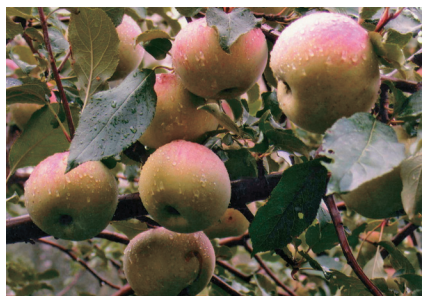
Рис. 1. Вавиловское [18-53-22 (Скрыжалец × OR18T13) × Уэлси тетраплоидный].