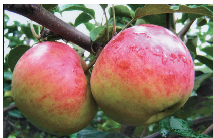
Рис. 4. Рождественское (Уэлси × VM41497).