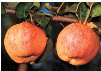
Рис. 2. Яблочный Спас (Редфри × Папировка тетраплоидная).