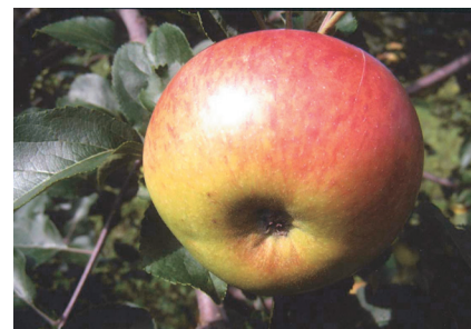
Рис. 3. Память Семякину [Уэлси × 11-24-28 (сеянец Голден Грайма)].