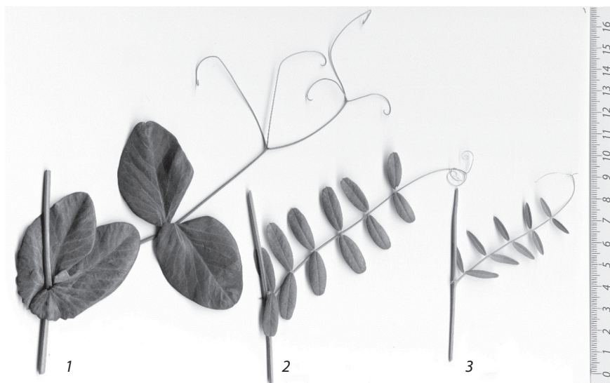
Рис. 2. Листья гороха сорта Дружная (1) и вики сортов Ленская 15 (2) и Новосибирская (3).

Таким образом, проведенные исследования позволили выделить сорт вики Ленская 15 и линию 4604/1-2 в качестве потенциальных доноров при селекции новых сортов вики с повышенной активностью азотфиксации.